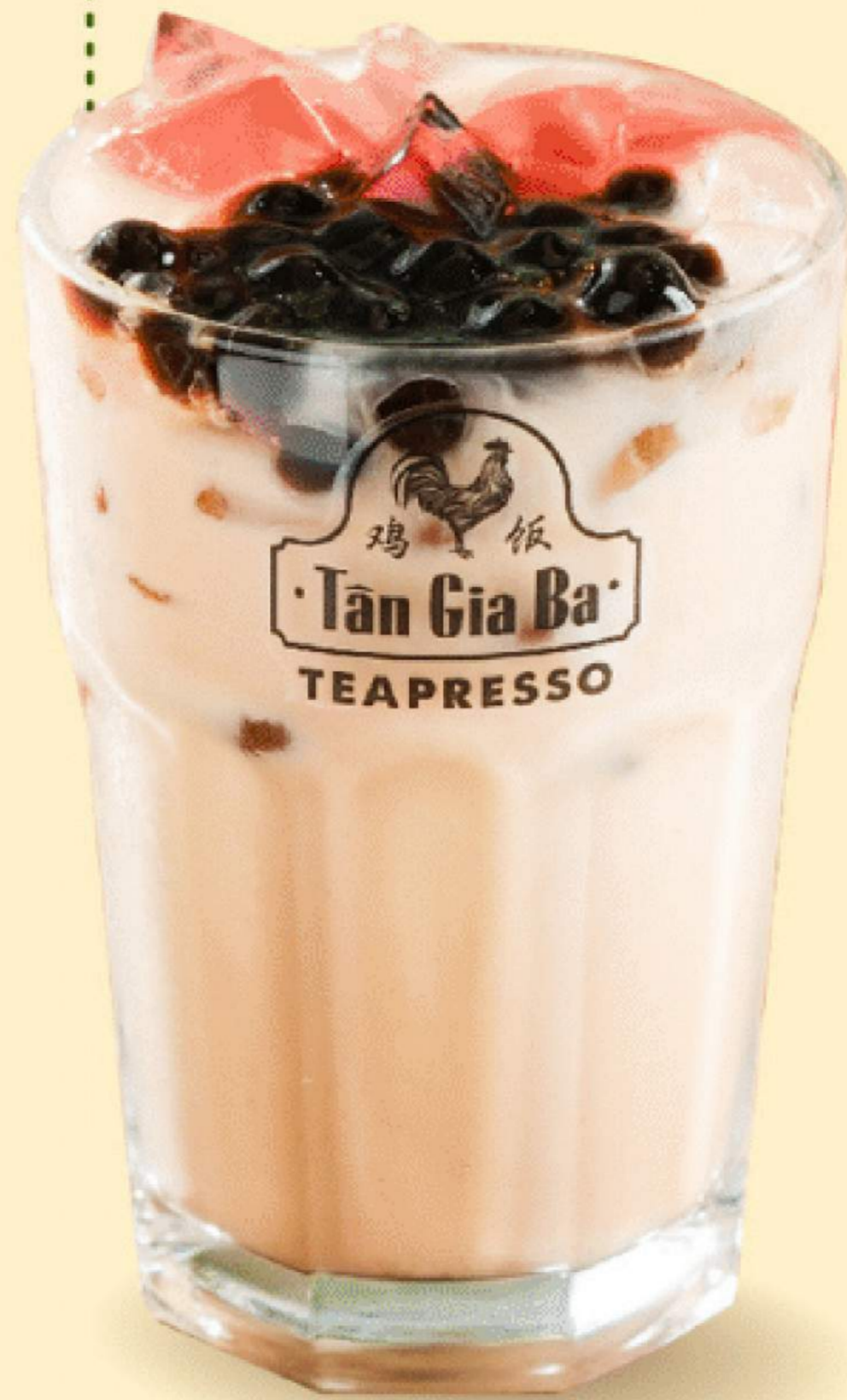
Ô LONG THƯỢNG HẠNG 49.000