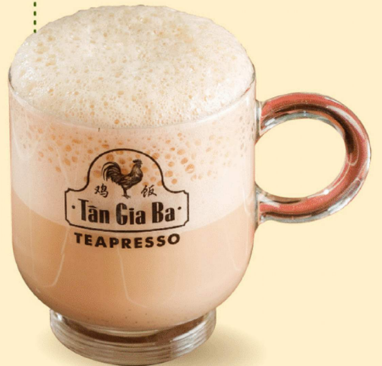
TRÀ SỮA UYÊN ƯƠNG 49.000