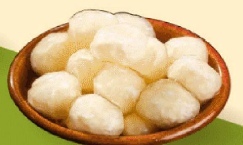
THẠCH PHÔ MAI 17.000