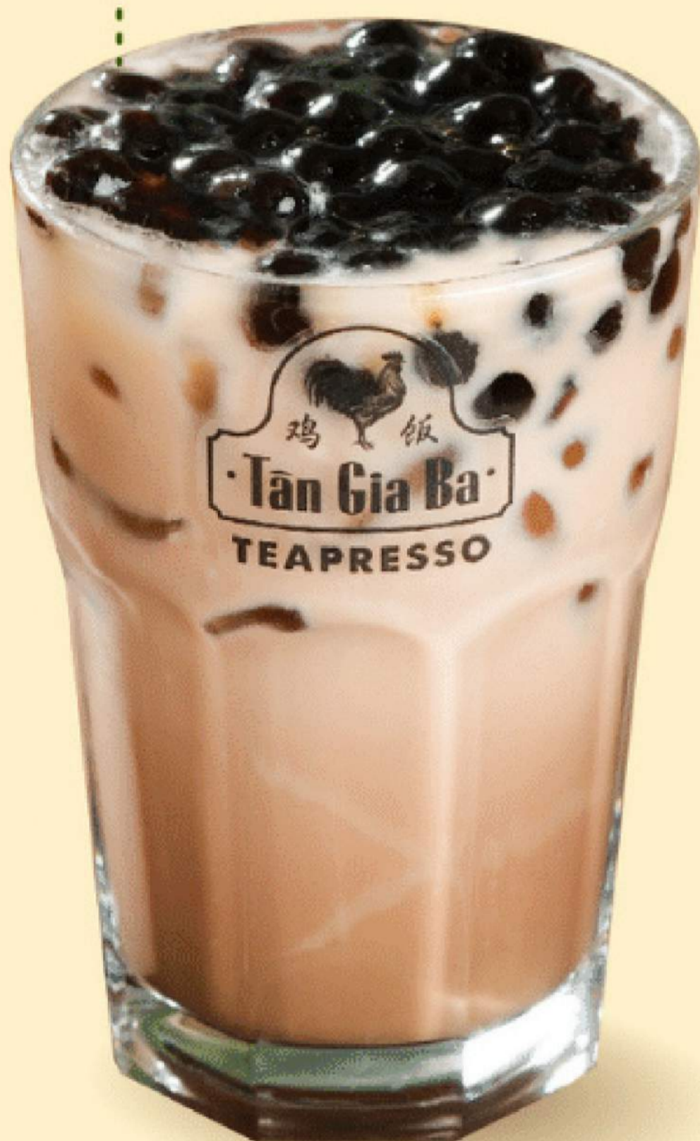
TRÀ SỮA TÁO 49.000