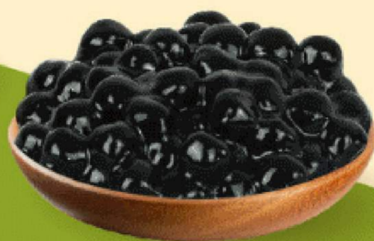
TRÂN CHÂU ĐEN 9.000