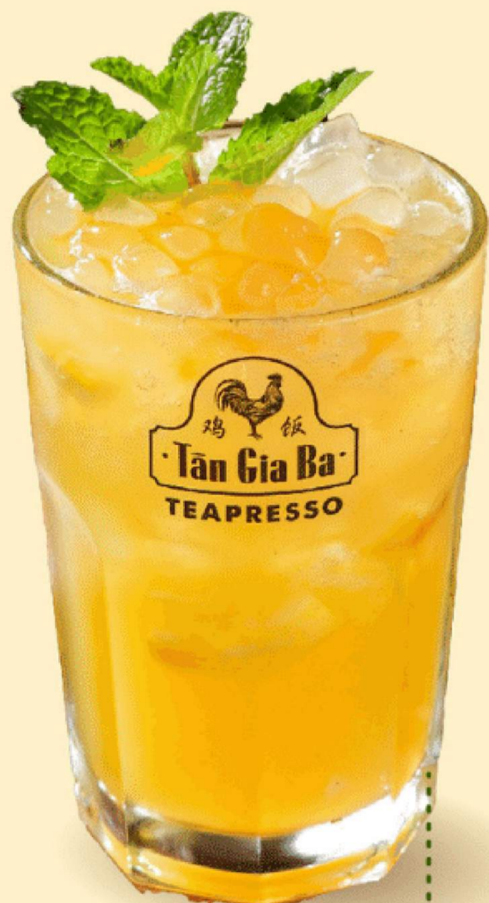
TRÀ XOÀI TÂN GIA BA 45.000