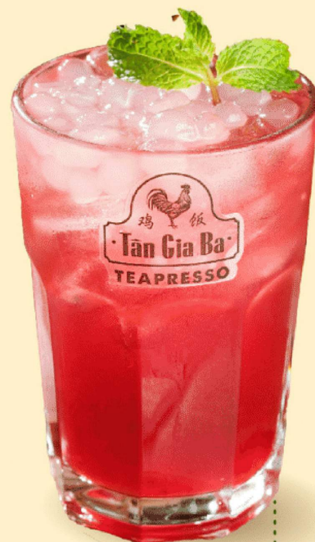
TRÀ NHIỆT ĐỚI 45.000