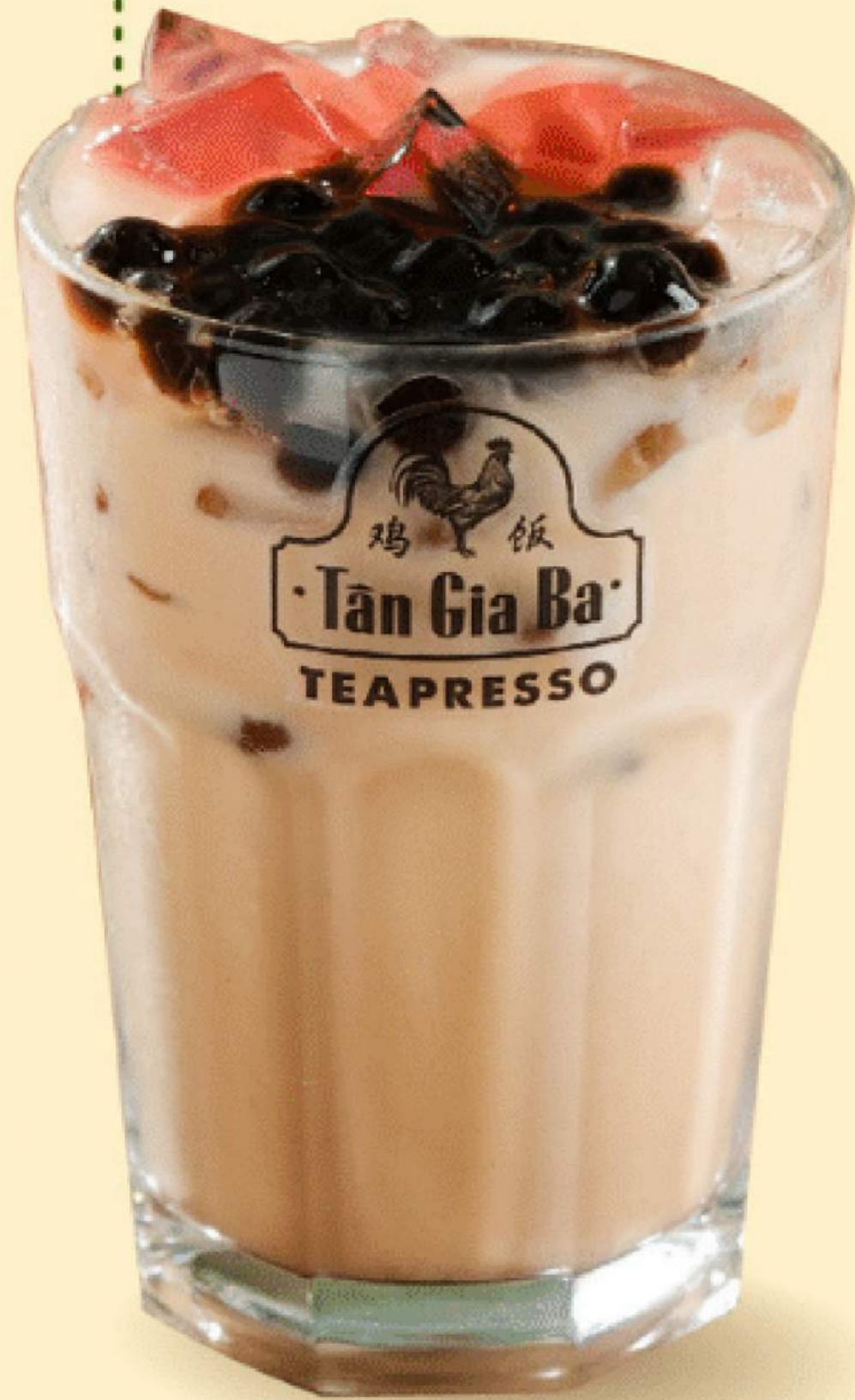
HỒNG TRÀ SỮA NGUYÊN LÁ 49.000