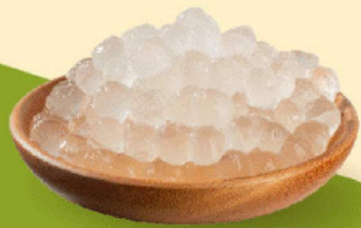
TRÂN CHÂU TRẮNG 9.000