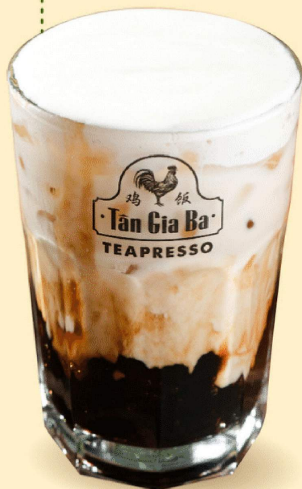
Ô LONG SỮA HOA LÀI 49.000