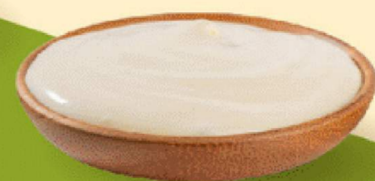
KEM MACCHIATO 9.000