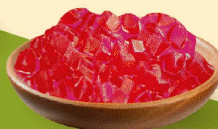
THẠCH DÂU NHỎ 12.000