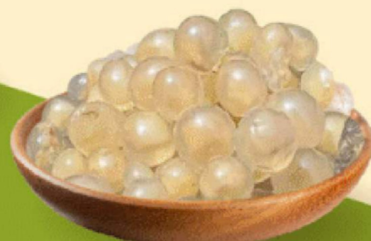
THẠCH NỔ CỦ NẶNG 12.000