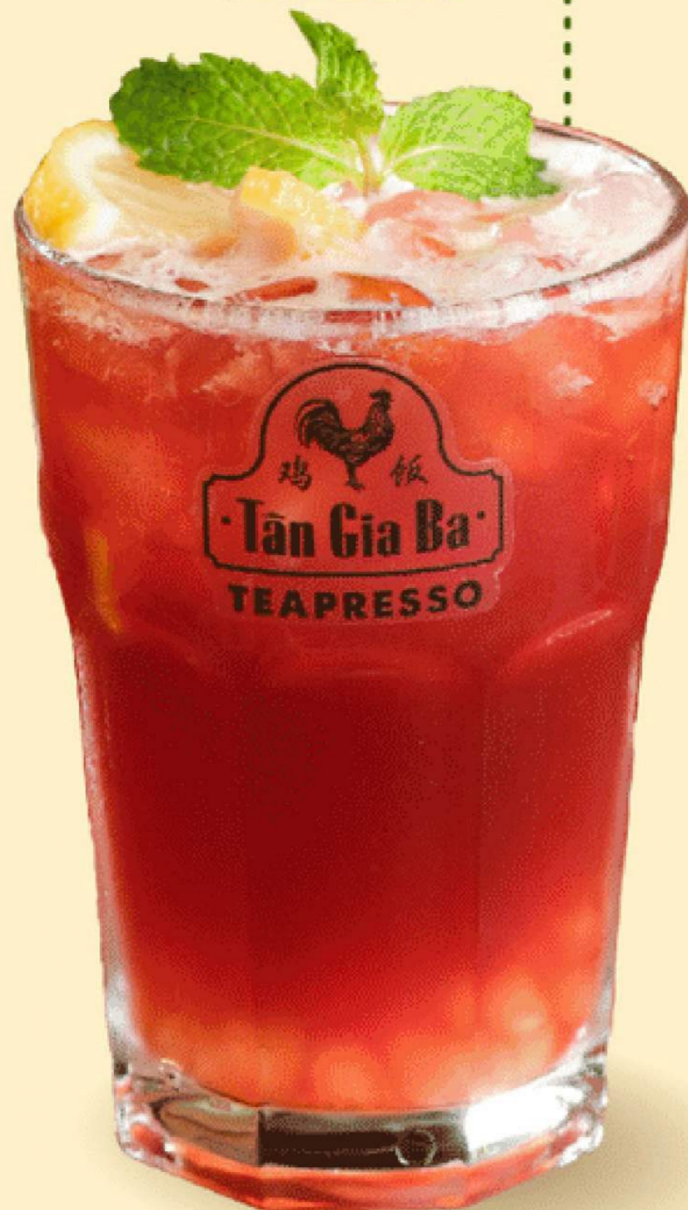
TRÀ DÂU TÂY 45.000