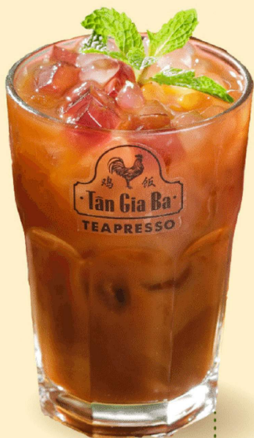
TRÀ TÁO YÊN 45.000